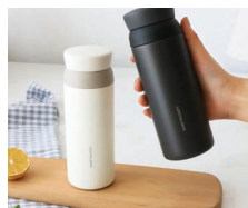
乐扣经典款保温杯