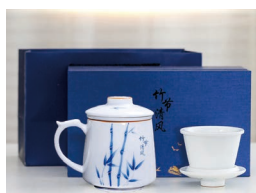
“竹节清风”茶水分离 陶瓷马克杯