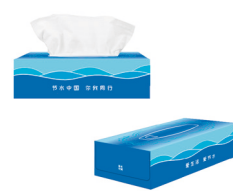
节水主题盒装抽纸