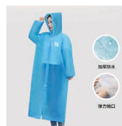
EVA环保材质加厚雨衣