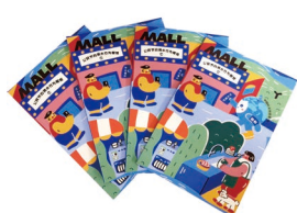
《公民节约用水行为规范》 插画笔记本