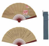
廉洁主题绢布折扇