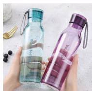
乐扣运动便携塑料杯