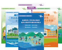
节水“五进”宣传海报