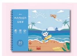
学生图画本 (马克笔专用)