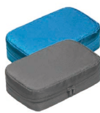
公务出行悬挂式洗漱收纳包