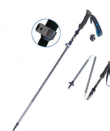
户外运动 可折叠登山杖