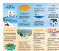
学习贯彻《节约用水条例》 折页