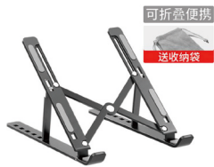
阅读支架 (笔记本电脑、IPAD可用)