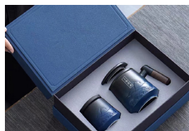
“上善若水”陶瓷杯套装