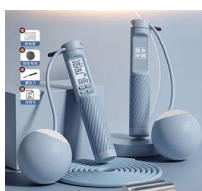
电子计数跳绳套装