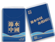
节水主题手帕纸 (10包/条)