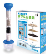
“净水小课堂” 科学实验套装