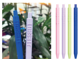
“节水”字母款黑色签字笔