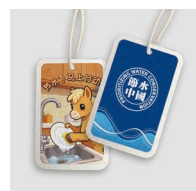
创意压缩木浆洗碗棉