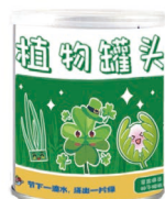
植物罐头/桌面盆栽