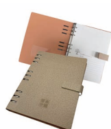
办公会议 活页笔记本