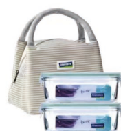
玻璃保鲜盒 高端品牌三件套