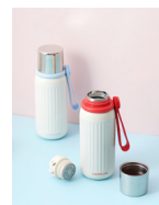
乐扣提手款保温杯