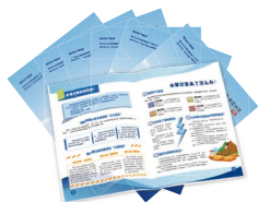
《“世界水日·中国水周”特刊》