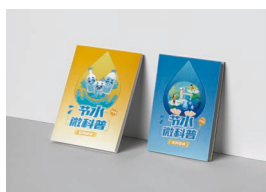
《节水微科普》辅导读本 (学生版/公众版)