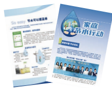
《家庭节水行动》 单页