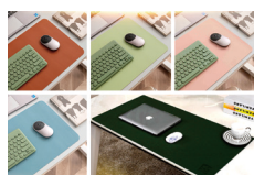
“节水中国” PU长款鼠标垫