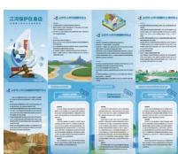
《江河保护在身边》 折页