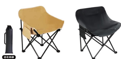
户外折叠休闲椅/月亮椅