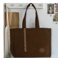
“节水中国”水文化帆布包