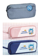
多层大容量学生笔袋