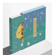
《历史治水名人讲堂》 音像制品