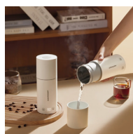
乐扣便携烧水保温杯