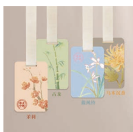
“节水中国”香挂/香片