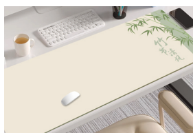
“竹节清风”长款鼠标垫