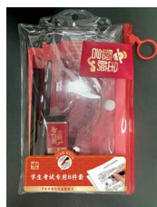
“节水进校园” 学生考试套装（8件套）