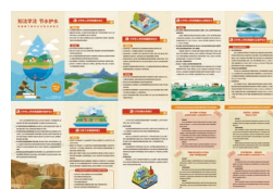
《知法学法 节水护水》 折页