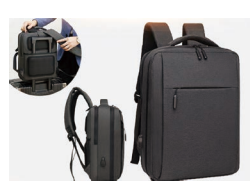
公务出行加厚 双肩电脑包