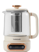
乐扣养生壶电热水壶