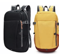
轻便户外运动 双肩背包（20L）