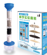
“净水小课堂” 科学实验套装