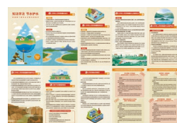
《知法学法 节水护水》 折页