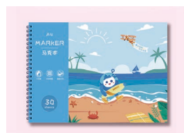
学生图画本 (马克笔专用)