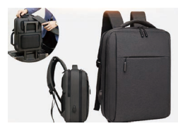
公务出行加厚 双肩电脑包