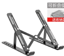
阅读支架 (笔记本电脑、IPAD可用)