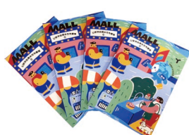
《公民节约用水行为规范》 插画笔记本