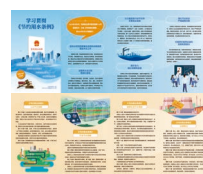
学习贯彻《节约用水条例》 折页