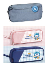
多层大容量学生笔袋