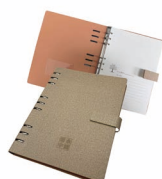
办公会议 活页笔记本