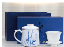
“竹节清风”茶水分离 陶瓷马克杯