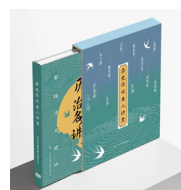
《历史治水名人讲堂》 音像制品