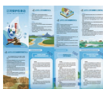
《江河保护在身边》 折页