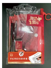
“节水进校园” 学生考试套装（8件套）