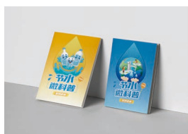
《节水微科普》辅导读本 (学生版/公众版)